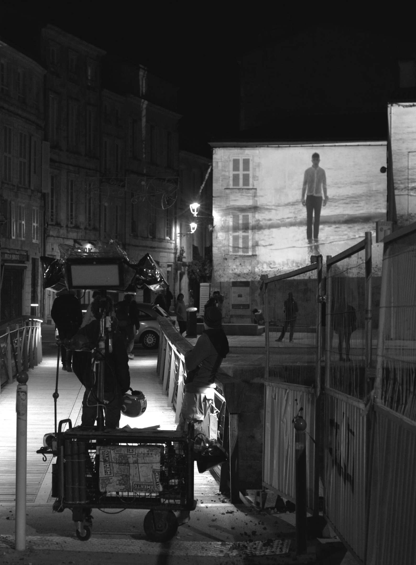
Doc urbain : déambulation avec KompleX Kaphanaüm aux Escapes Documentaires 2021, en partenariat avec le CNAREP - Sur le Pont